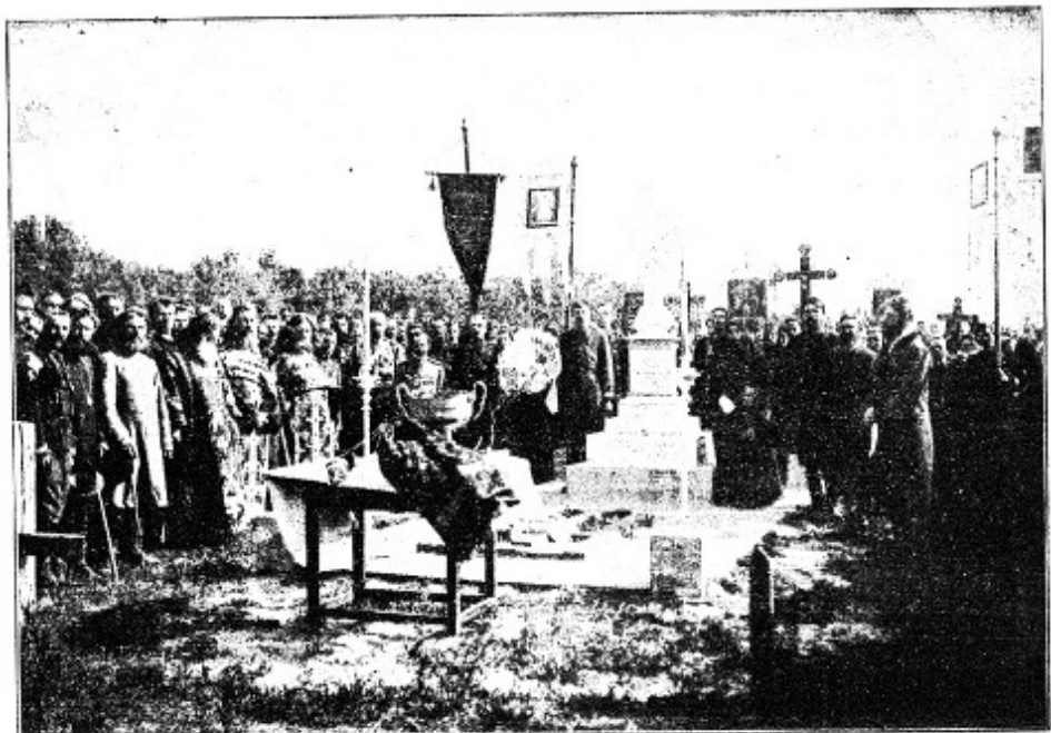
Освящение памятника Барабанову и Бубнову.

одного из важных направлений обеспечения духовно-нравственной устойчивости корпорации полицейских служителей и всего общества Российской империи. Соответствующая деятельность, с одной стороны, была связана с формированием особого исторического нарратива, что получило отражение в нормативных правовых основах функционирования уездной полицейской стражи 1 . Полицейские чины должны были ощущать чувство принадлежности к правоохранительной корпорации, региону (месту несения службы), обществу и всему государству. Должного результата руководство МВД стремилось достичь, в первую очередь, через систему профессиональной подготовки, а также через ведомственную периодическую печать. С другой стороны, в условиях существенных социально-политических потрясений конца XIX – начала XX столетия требовалось создать позитивный образ полицейского и в сознании всего населения. Наиболее эффективным способом для этого было признано сохранение памяти о героических примерах исполнения служебного долга.